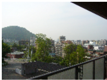
バルコニーからの眺望 円山方面